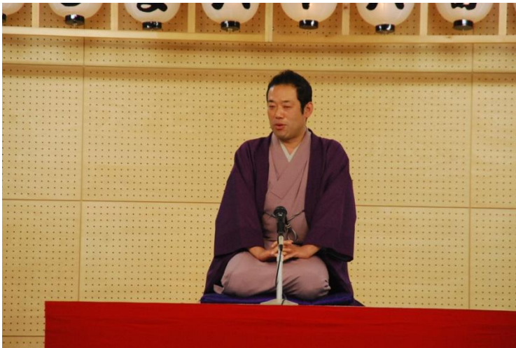
桂 まん我 「つぼ算」