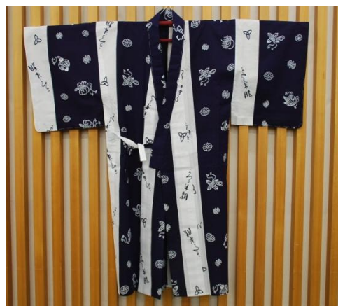
桂米朝師匠 無形文化財(人間国宝)認定記念 米朝師匠奥様の図案 「宝づくし柄」

今回は、桂米朝師匠が無形文化財（人間国宝）に認定された際、「紫綬褒章」受章の際や、桂南光師匠が還暦の際に、記念でつくられた浴衣を会場後方に掲示しました。