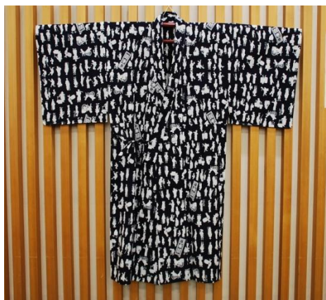
桂米朝師匠 紫綬褒章受章記念 「錦影絵図柄」